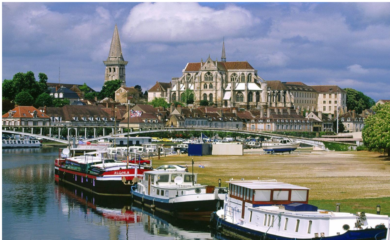
AUXERRE , ville de sports et de tourisme

POLIGNY - AUXERRE = 2h10 ou 240 kms MONTMORENCY - AUXERRE = 2h20 ou 190 kms CORBEIL - AUXERRE = 1h20 ou 130 kms MEAUX - AUXERRE = 1h50 ou 200 kms DIJON - AUXERRE = 1h20 ou 150 kms BELFORT - AUXERRE = 3h00 ou 330 kms BAUME LES DAMES - AUXERRE = 2h30 ou 280 kms