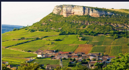
La roche de Solutré