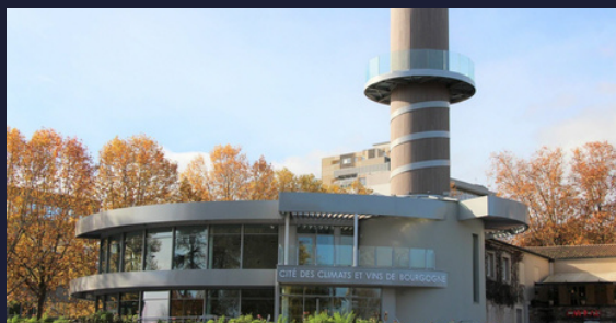
La cité des vins